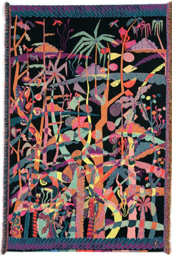
After Long Consideration And Soul Searching The Smoking Croissant Turned Out To Be My Mom, Jacquard geweven, 250 x 170 cm, 2020